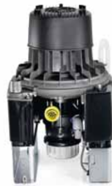
7125-01/002 VSA 300S

Aspiración húmeda con recuperador de amalgama (1Puesto)