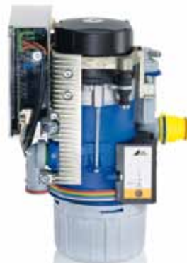
7117-81 CA 1