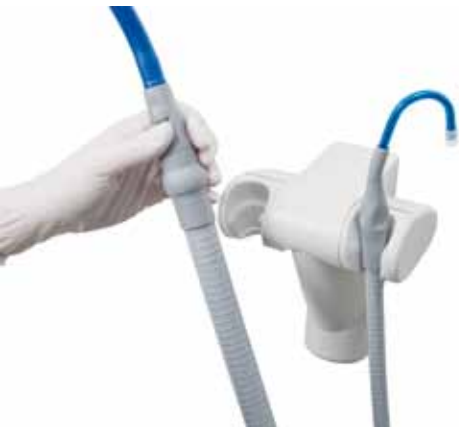
7603G01 SOPORTE CÁNULAS

Soprote de cánulas Comfort GFK gris con filtro central incorporado