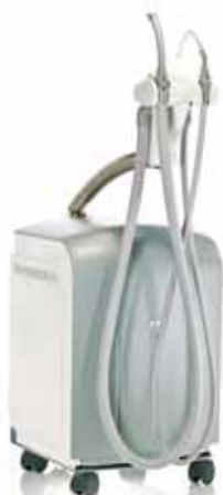
0624-100-55 VARIOSUC VS