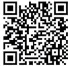
DÜRR DENTAL FACTORY