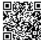
COMPRESORES DÜRR DENTAL